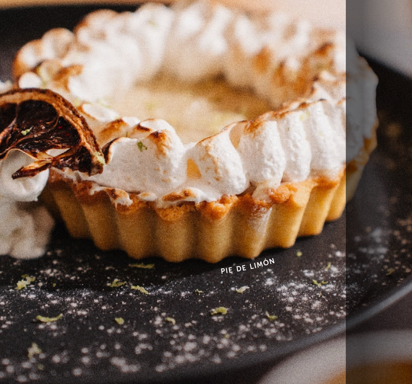
PIE DE LIMÓN

Pan de Zanahoria Galletas (Chocolate y arándanos) Pundcake de canela